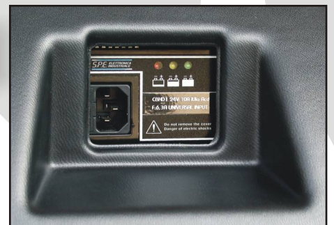
Caricabatterie incorporato alta frequenza con indicatore di carica batteria e blocco forche