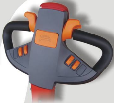
Versione cella Frigorifera -30°C