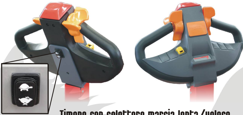
Timone con selettore marcia lenta/veloce