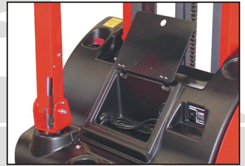
Portaoggetti completo di portello di chiusura