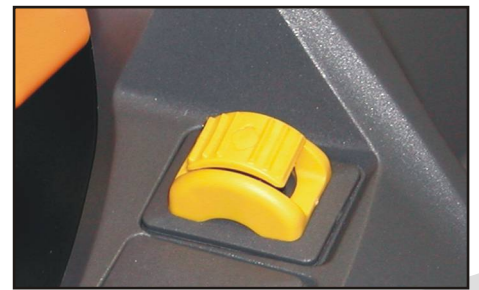
Roller per il controllo della velocità di discesa delle forche