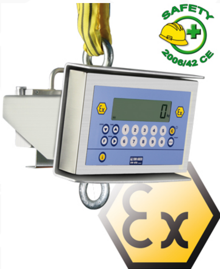
Dinamometri MCWX2GD per pesatura in zone ATEX

Dinamometri per applicazioni di pesatura in zone ATEX classificate a rischio di esplosione (ZONA 1 e 21, 2 e 22) con modo di protezione secondo Ex II 2GD IIC T4 T197°C X. Struttura completamente in acciaio INOX, con grado di protezione IP68.