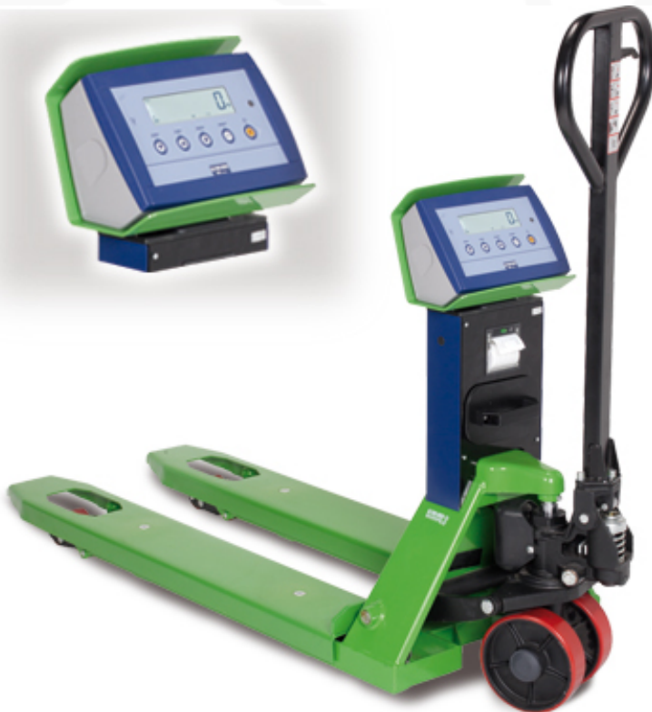
Transpallet pesatore TPWA con stampante opzionale

Transpallet con pesatura elettronica integrata. L'indicatore girevole garantisce il massimo confort di lettura. Affidabili, adatti per condizioni gravose di lavoro, sono indispensabili dove occorre pesare con precisione qualsiasi tipo di prodotto su pallet. Disponibili anche in versione OMOLOGATA CE-M